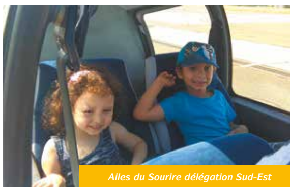
Ailes du Sourire délégation Sud-Est