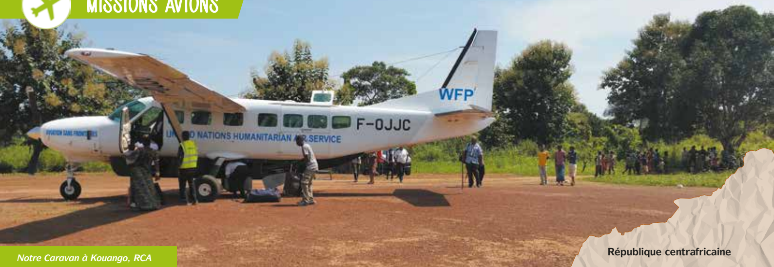
Notre Caravan à Kouango, RCA