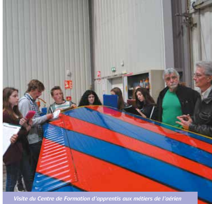
Visite du Centre de Formation d'apprentis aux métiers de l'aérien