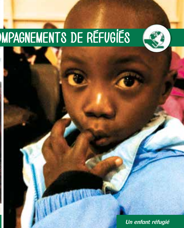
Un enfant réfugié

50 000 CONGOLAIS SERONT AUTORISÉS À MIGRER VERS LES ÉTATS-UNIS.