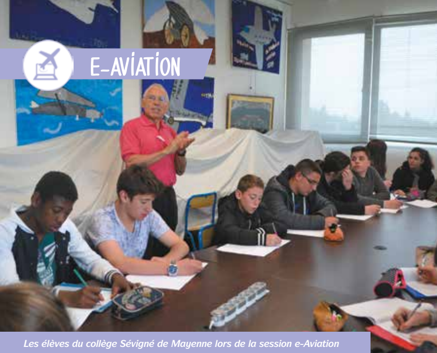
Les élèves du collège Sévigné de Mayenne lors de la session e-Aviation