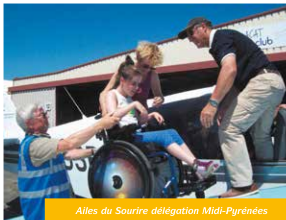
Ailes du Sourire délégation Midi-Pyrénées