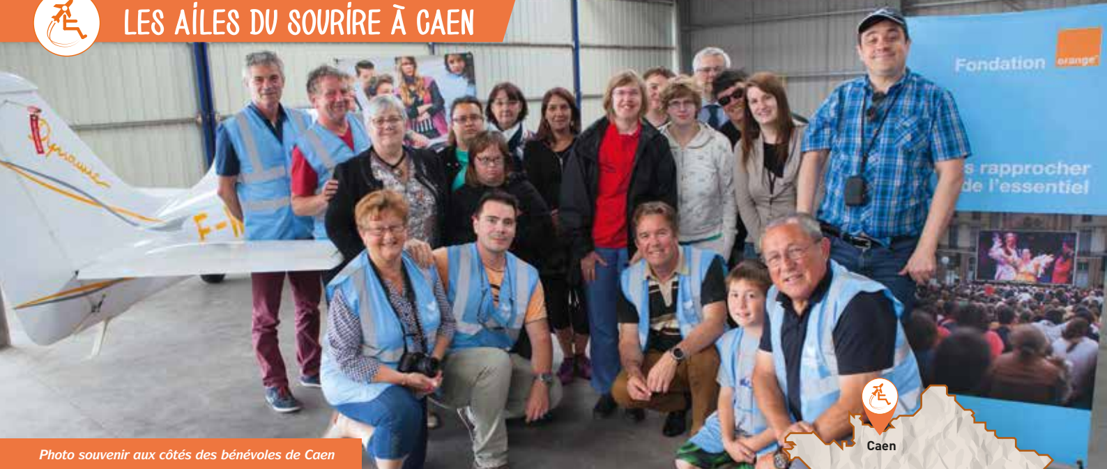
Photo souvenir aux côtés des bénévoles de Caen