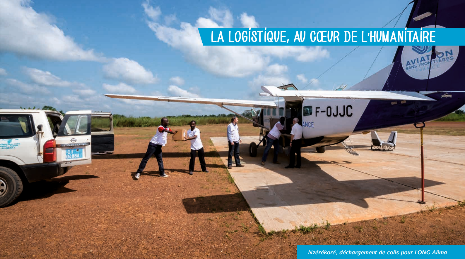
Nzérékoré, déchargement de colis pour l'ONG Alima