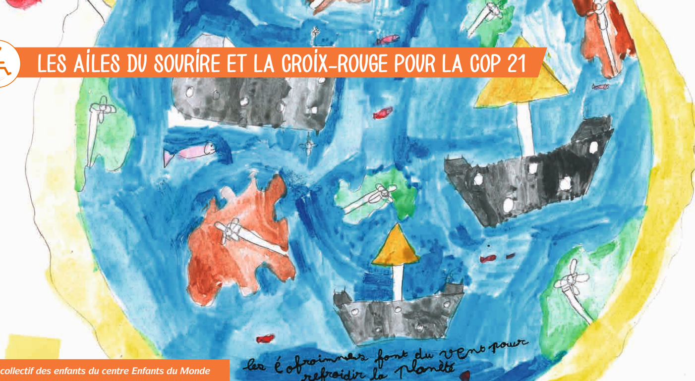
Dessin collectif des enfants du centre Enfants du Monde