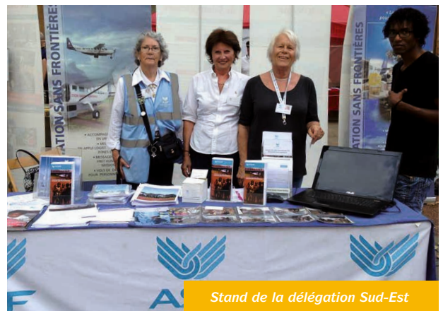
Stand de la délégation Sud-Est