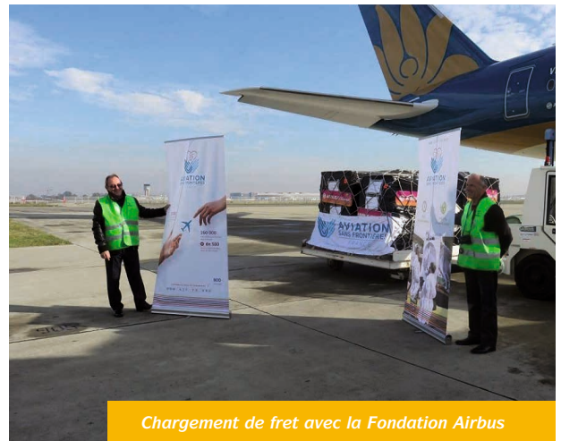
Chargement de fret avec la Fondation Airbus