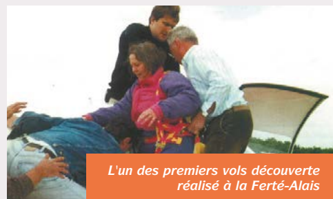
L'un des premiers vols découverte réalisé à la Ferté-Alais

C'est ici que tout a commencé. En 2012 cependant, les Ailes du Sourire marquent un temps d'arrêt avant de reprendre leur envol à l'automne dernier, sous l'impulsion d'une équipe de bénévoles. Au menu pour la saison 2015 : 22 journées organisées d'avril à septembre avec 20 structures, 175 personnes handicapées prises en charge et 90 vols découverte programmés.