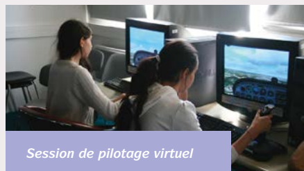
Session de pilotage virtuel

L'OCDE relève, qu'en France, le taux des jeunes de 15 à 19 ans scolarisés est passé de 89 % en 1995 à 84 % en 2010. 71 % des jeunes déscolarisés de cette tranche d'âge sont sans emploi ou inactifs.