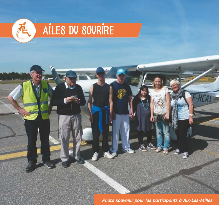
Photo souvenir pour les participants à Aix-Les-Milles