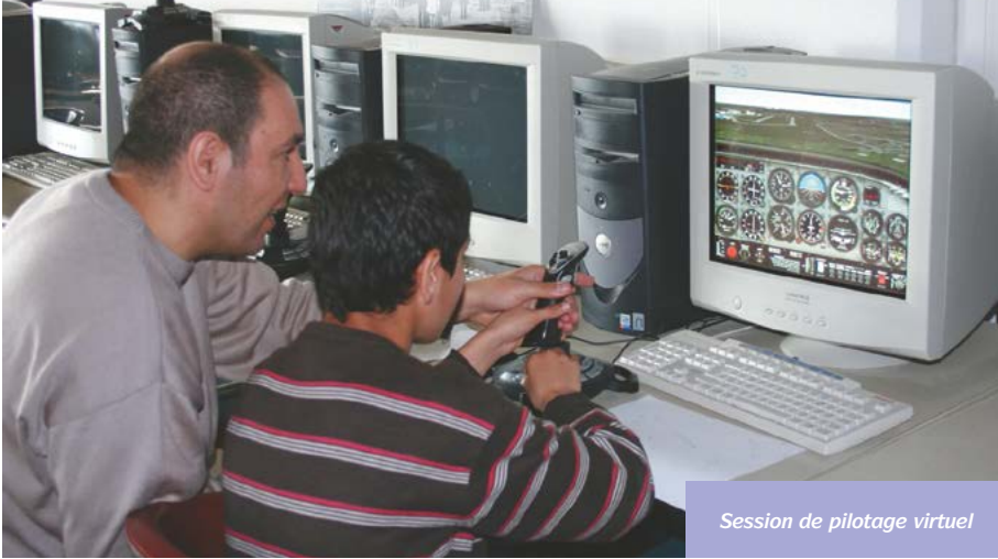
Session de pilotage virtuel