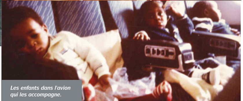
Les enfants dans l'avion qui les accompagne.

ainsi pu être guéris ». Cette année-là, 129 enfants ont pu être soignés. Trois décennies plus tard, les « Cigognes » volent toujours plus haut. Une équipe de 10 bénévoles se relaie chaque jour au siège d'ASF pour gérer en moyenne quotidiennement 3 allers ou retours d'enfants malades.