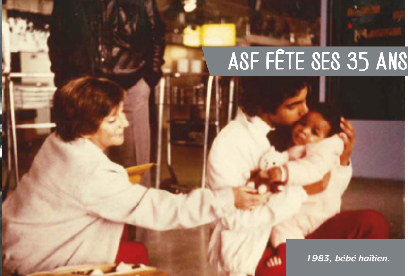
1983, bébé haïtien.