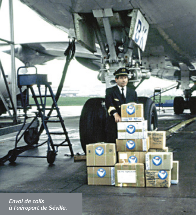
Envoi de colis à l'aéroport de Séville.