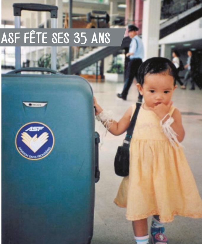
1981, le début des accompagnements d'enfants.