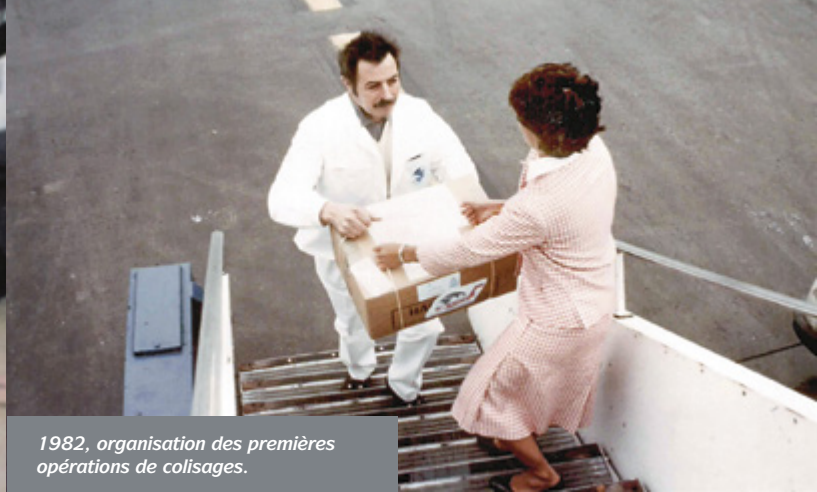
1982, organisation des premières opérations de colisages.