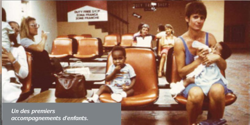
Un des premiers accompagnements d'enfants.