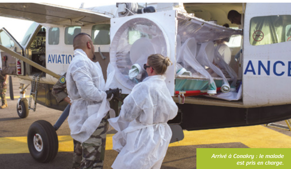
Arrivé à Conakry : le malade est pris en charge.

Depuis décembre 2014, ASF opère en Guinée dans le cadre de la lutte contre Ebola. Parfois confrontés à des appels urgents, les pilotes doivent transporter vers Conakry des personnes suspectées d'être contaminées par le virus.