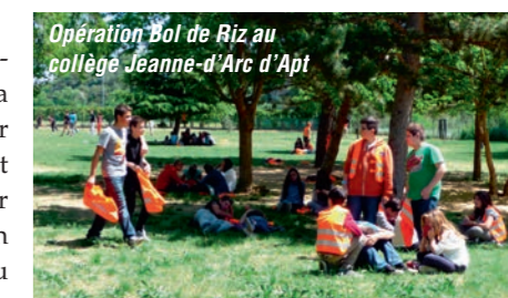
Opération Bol de Riz au collège Jeanne-d'Arc d'Apt

La délégation régionale poursuit ses actions dans le cadre des Ailes du Sourire. Quatre adolescents autistes de l'Institut Médico-Educatif de Gap (05) ont ainsi récemment pu participer à une journée de découverte aéronautique, toujours pour leur plus grand bonheur ainsi que celui des accompagnateurs.