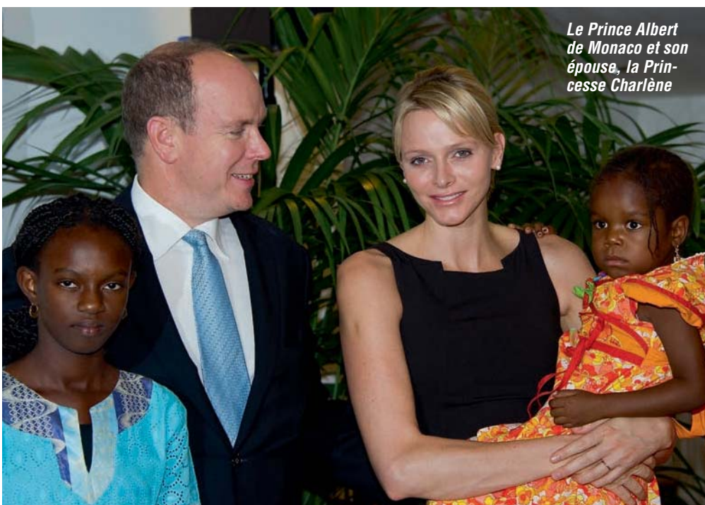
Le Prince Albert de Monaco et son épouse, la Princesse Charlene

du Département des Relations Extérieures, est de réaliser des opérations chirurgicales en Principauté pour des enfants venus de pays en développement dont les pathologies n'auraient pu être traitées dans leur pays d'origine, notamment en cardiologie et en orthopédie.