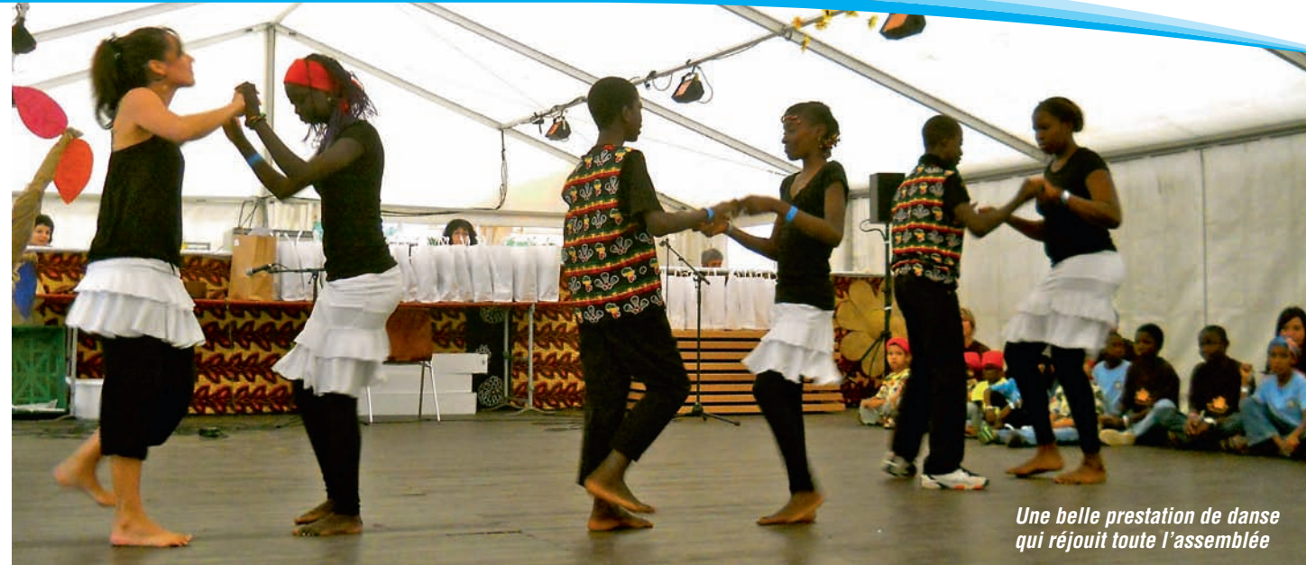
Une belle prestation de danse qui réjouit toute l'assemblée