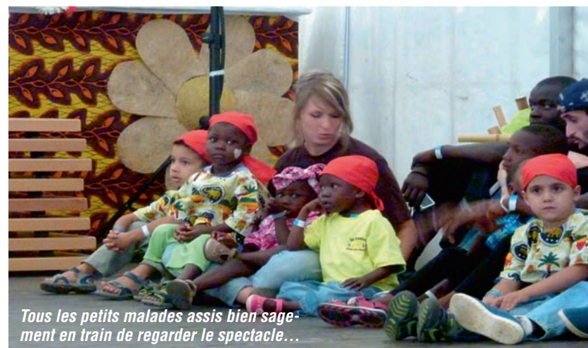
Tous les petits malades assis bien sagement en train de regarder le spectacle...