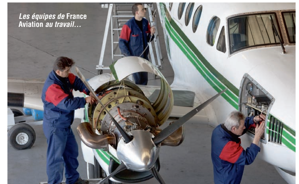
Les équipes de France Aviation au travail...

La Lettre : À Kinshasa, ASF a dû s'adapter à ces nouvelles règles et pour ce faire, louer un hangar et le doter de tout l'outillage spécifique, conformément aux exigences européennes en