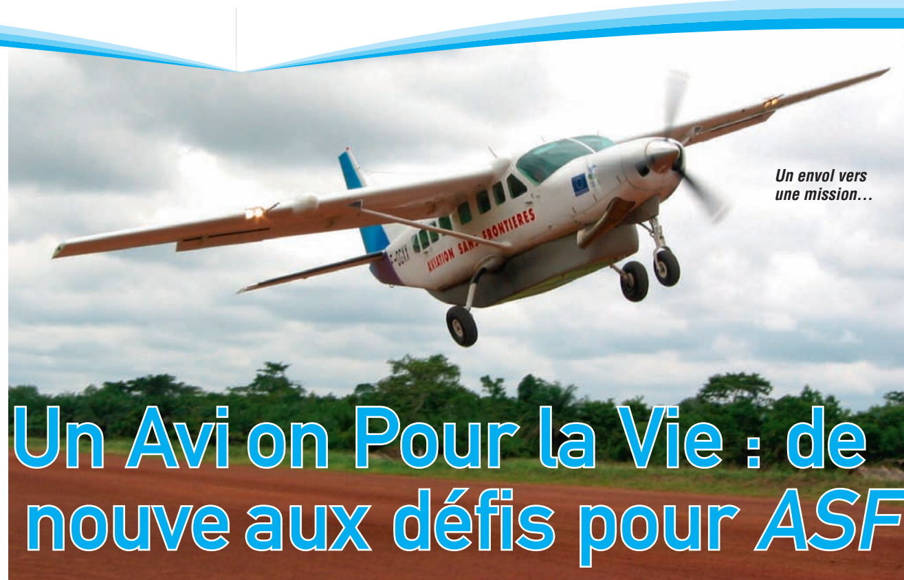
Un envol vers une mission...

LA LETTRE est entièrement réalisée par des bénévoles.