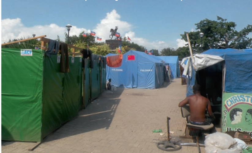
Les tentes bleues des camps de réfugiés encore situés en pleine ville !