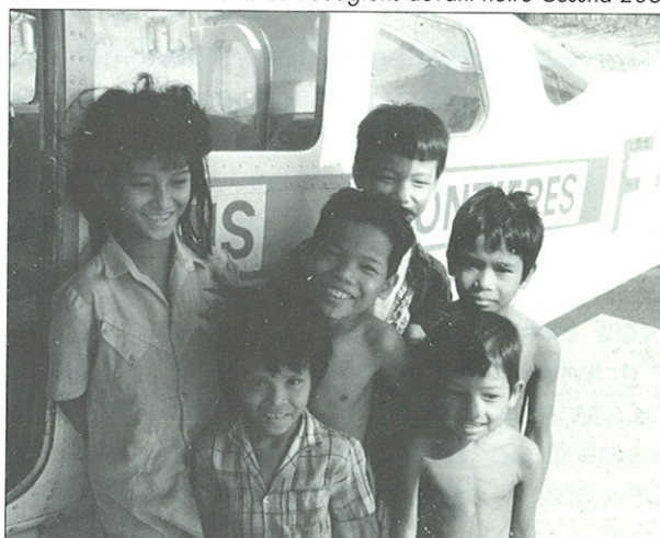
Enfants cambodgiens devant notre Cessna 206.