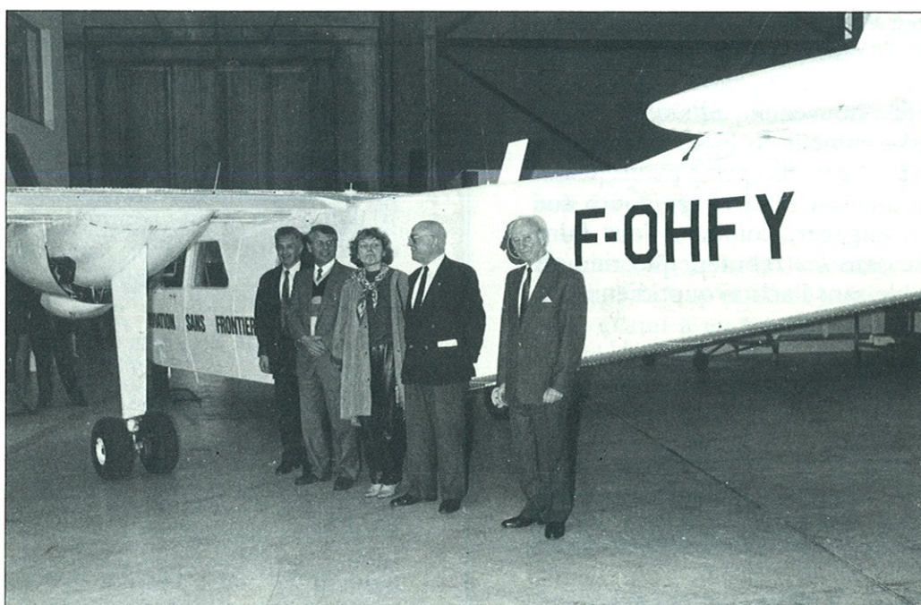
Photo de la cérémonie de remise du BN2 acquis grâce à la générosité des Lion's Club